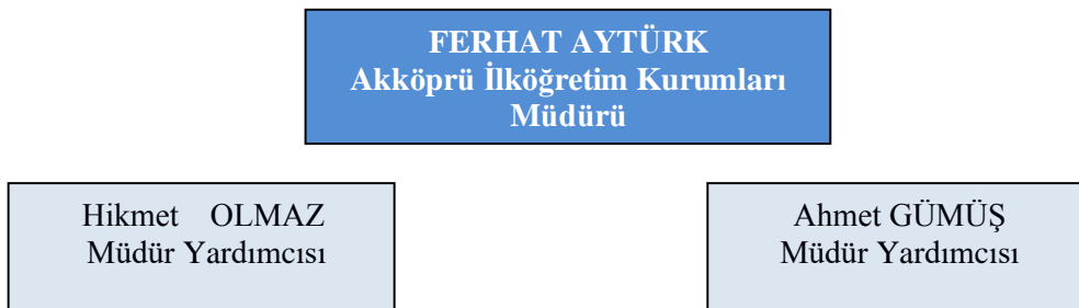
Şekil 2: Akköprü İlköğretim Kurumları Müdürlüğü Teşkilat Yapısı